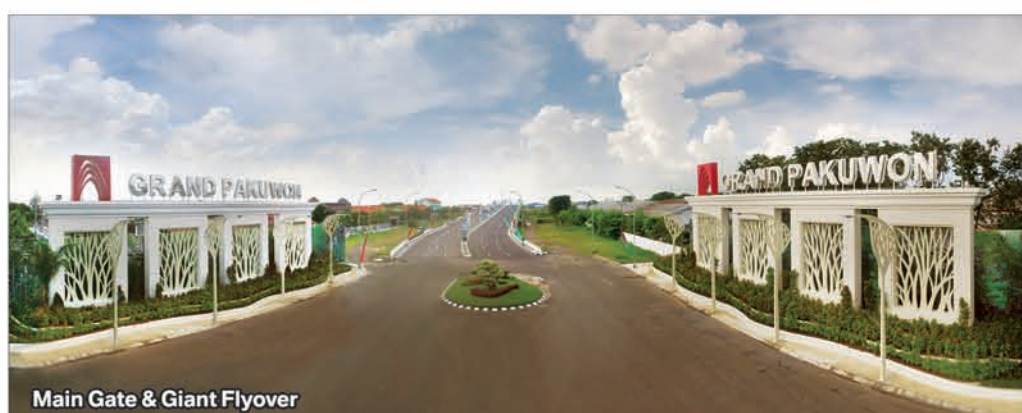
Main Gate & Giant Flyover