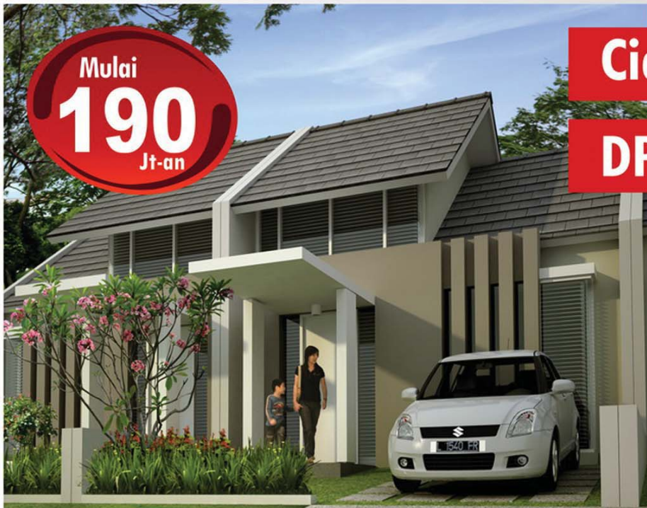
ASTORIA T 49/90