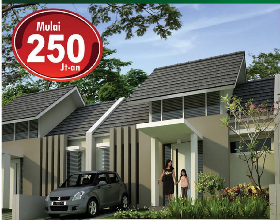
ESTONIA T 62/120