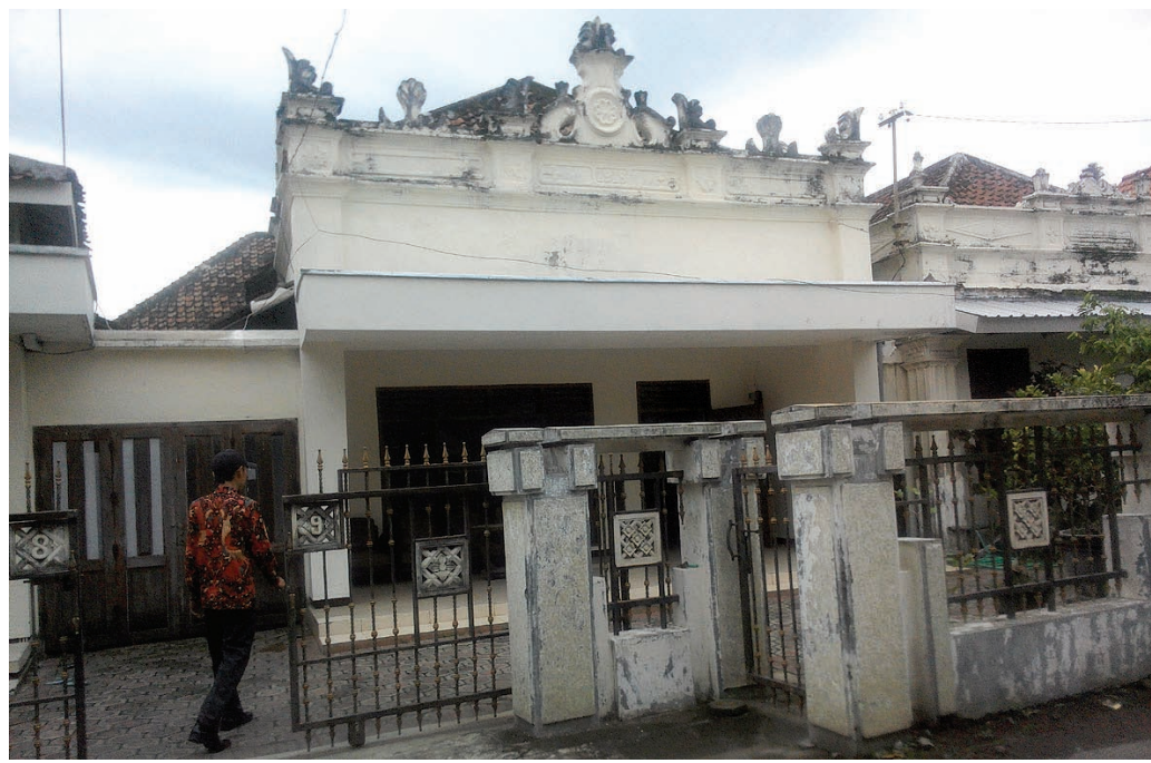
MUS PURMADANI/RADAR SIDOARJO

TEMPO DOELOE: Beberapa rumah milik warga Desa Kedungcangkring, Jabon, yang masih terawat.