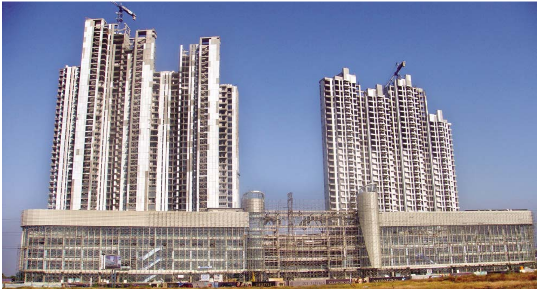
PRESTISIUS: The Adhiwangsa Golf Residence dan Lenmarc Shopping Paradise merupakan bagian dari proyek prestisius Bukit Darma City. Semua unit menghadap ke padang golf.

Ini merupakan satu-satunya apartemen di Indonesia yang didesain pipih dan single koridor sehingga antara unit satu dengan lainnya tidak saling berhadapan. “Tower I sudah terjual sekitar 75 persen. Sedangkan tower II belum kami pasarkan,” ujarnya sambil